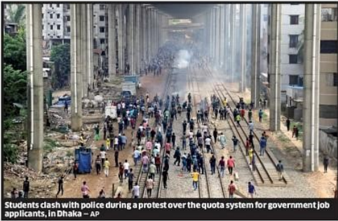
Students clash with police during a protest over the quota system for government job applicants, in Dhaka

Sources from Dhaka said that the Hasina government is reviewing the situation. In New Delhi, top brass of the Indian government is closely monitoring the situation. Instability and unrest in Bangladesh have a direct impact on India's security and economic interests in West Bengal and Northeast. Experts on Bangladesh, who did not wish to be quoted, feared that the anti-Hasina movement could transform into an anti-India movement unless the situation is handled deftly. Strengthening of radical forces in Bangladesh is inimical to India's interests.